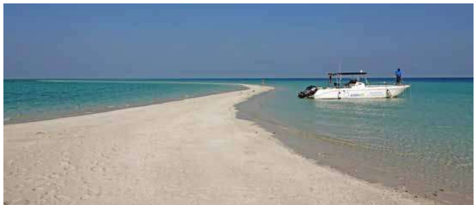
Figuur 2. De wateren rond Bahrein zijn in het algemeen erg ondiep. Oesterbanken komen hier al voor vanaf 2,5 meter diepte. Veel zandbanken komen droog te liggen tijdens eb, maar verdwijnen bij vloed onder water.

De laatste twintig jaar is het aantal actieve duikers toegenomen tot ongeveer 3000. Ze duiken één tot vijf keer per