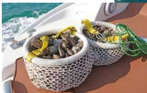
Figuur 3. Met speciale toestemming van de overheid verzamelen duikers tenminste één keer per week pareloesters tot 20 meter diepte, meestal met gebruik van perslucht. Deze duiker maakte een korte verkennende duik om de oesterstand te inspecteren. In een groep van zes personen mocht één persoon per duik maximaal 60 oesters verzamelen.

Daarbij is het risico van 'overbevissing' laag. Bij het verzamelen van pareloesters die los moeten worden gemaakt van de zeebodem geldt steeds een heel oude regel: zeven tot acht maanden mag worden gedoken en de rest van het jaar niet. Daarnaast is het soort oester, Pinctada radiata , een zogenaamde 'invasieve soort', die zich razendsnel vermenigvuldigt. Voor het goede evenwicht van de ecologie in de kustwateren is het daarom goed dat er op deze wijze gevist wordt.