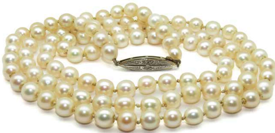
Figuur 6. Zeldzaam natuurlijk parelcollier, bestaande uit 107 natuurlijke parels met een diameter variërend van 5,6 tot 6,9 mm. Recent onderzocht op het Nederlands Edelsteen Laboratorium.