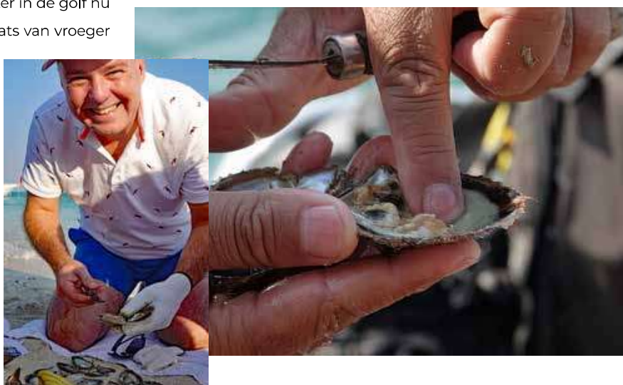
Figuur 4. Gemiddeld moeten 50 kleine pareloesters worden opengemaakt om een (heel) kleine parel te vinden. De auteur mocht een dag ervaren hoeveel moeite het kost om significante natuurlijke parels te verzamelen. Uiteindelijk zijn 9 parels gevonden in 360 pareloesters, alle kleiner dan 3 mm.

De oogst is momenteel 'goed' als er een halve kg per maand wordt gevonden. Honderd oesters moeten worden opengemaakt om ongeveer één tot vier parels te vinden (Fig. 4). De pareloester in dit gebied, Pinctada radiata , is niet