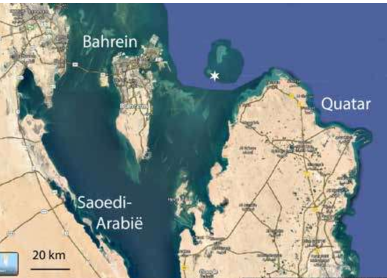
Figuur 1. Google satellietbeeld van Bahrein, net als Koeweit een klein oliestaatje, waar al 7000 jaar naar natuurlijke parels wordt gevestigd. De witte ster geeft de plek weer waar de auteur naar parels heeft gedoken en ook daadwerkelijk een parel heeft gevonden.

DOOR: HANCO ZWAAN – NEDERLANDS EDELSTEEN LABORATORIUM