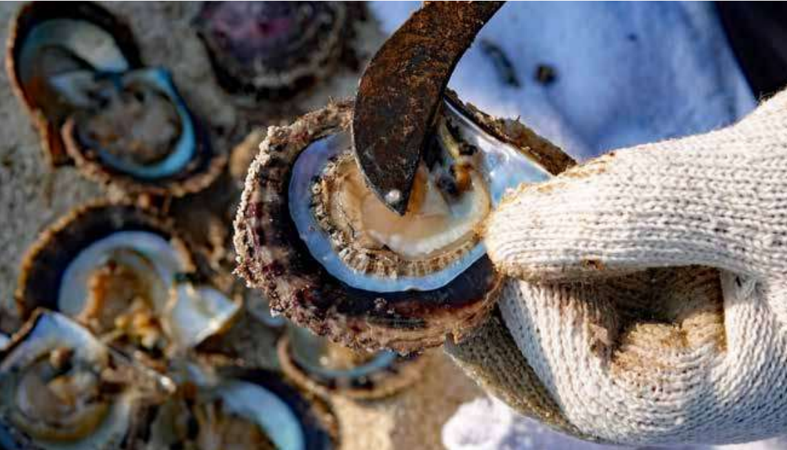
Figuur 5. Een ronde natuurlijke parel van 2 mm, net gevonden in een schelp van Pinctada radiata. Slechts iets meer dan 5% van de hier geviste natuurlijke parels is groter dan 3 mm.

erg groot en de meeste parels zijn dan ook erg klein, 1-2 mm (Fig. 5). Een parel van 4 mm is al heel bijzonder. Van 94,4 % van alle gevonden natuurlijke parels is de diameter kleiner dan 3 mm. Het is daarom niet eenvoudig om één parelsnoer van topkwaliteit samen te stellen (Fig. 6). Dit kan soms zelfs acht tot tien jaar duren. Natuurlijke parels zijn en blijven dus uiterst zeldzaam* en daardoor hoog geprijsd. In een van de luxe winkels in Manama, de hoofdstad van Bahrein, was een mooi voorbeeld te zien van een heel goed gesorteerd collier van ronde natuurlijke parels, oplopend van 4 tot 7 mm, ongeveer 40 cm lang. Dit collier werd aangeboden voor 100.000 Amerikaanse dollars (op het prijskaartje stond 140.000 dollar).